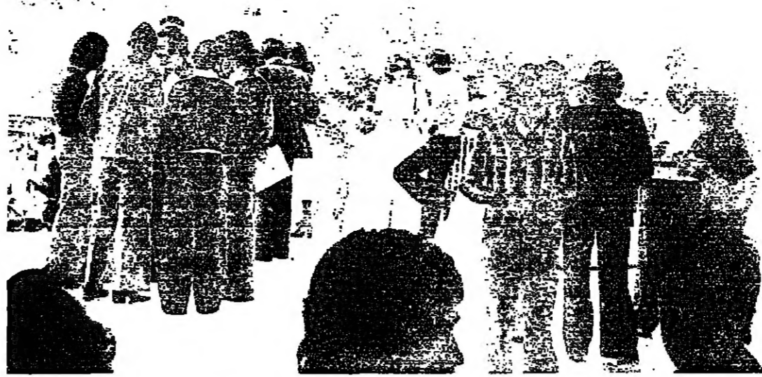
مجمع في باحة « القرن هل » ( العلوم الثانية )